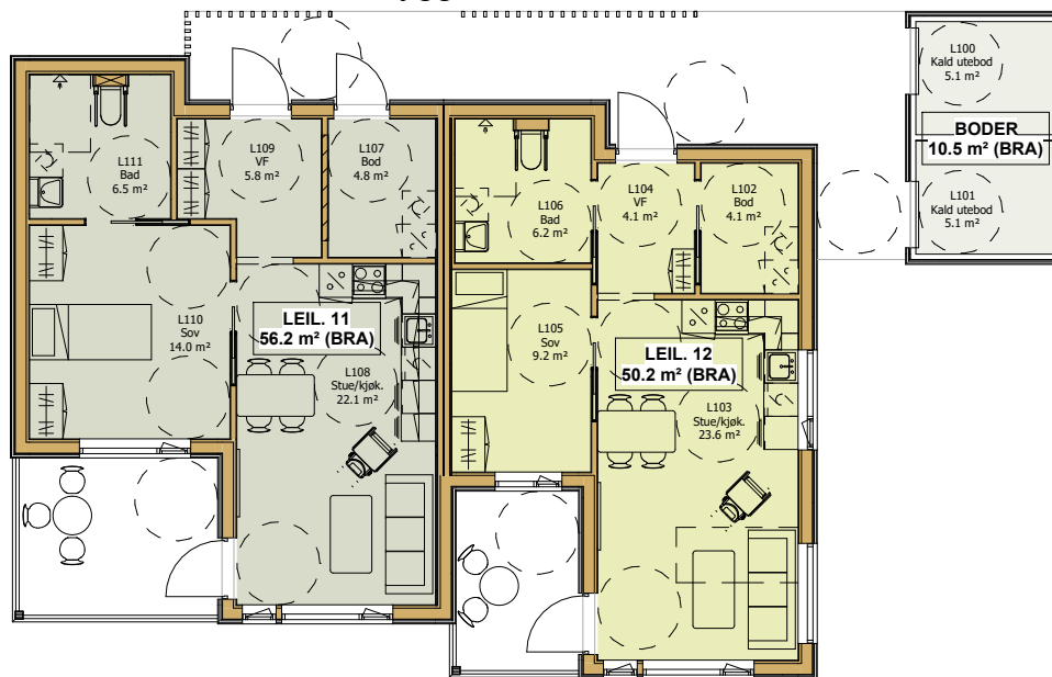
Plan 1, Bygg L